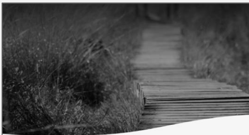
Gebed: Fluister tot mij